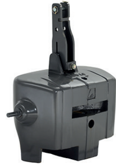
4291400M95 - 850 kg