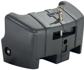
4291403M1 - 600 kg