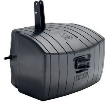
3907692M92 - 1.100 kg