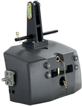
4385284M98 - 850 kg